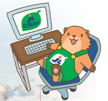
JL連合会 マスコットキャラクター 「パル」

続々と沢山の仲間が参画しています。是非、あなたもご参加頂きそのスケールを体感してみてください。