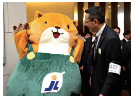
マスコットキャラクター「パル」

各地域本部大会、表彰式、親睦会、展示会への参加等のイベント行事を随時開催しています。